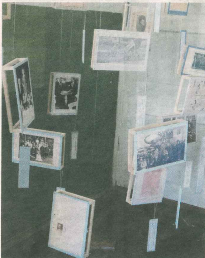
Parodos dailininkės Linos Jonikės sugalvotas neįprastas eksponavimo būdas: eksponatai pakabinti ant virvelių