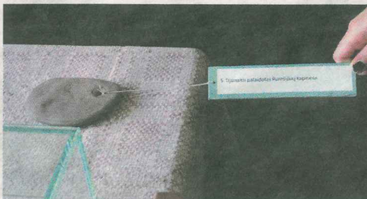
Įdomus parodos akcentas: akmenėlis su nuoroda, kur palaidotas S. Tijūnaitis