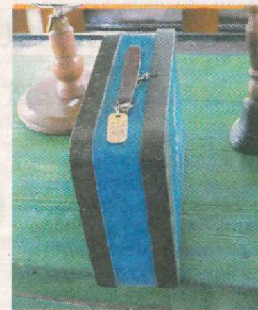
Anų laikų mokinio kuprinė